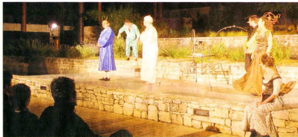
Un beau classique revisité qui se présente encore jusqu'au 15 août 2010 à 21h30, tous les soirs sauf les dimanches et lundis. Infos et réservations : 06 79 31 33 59

lieu, les comédiens jouent vraiment avec cette scène d'une grande originalité, utilisant toute l'espace, surgissant de tous les recoins, courant sur tous les niveaux. Les magnifiques costumes ont été entièrement fabriqués par les comédiennes. Samedi soir, malgré un mistral « glacial », le public était venu nombreux pour voir les acteurs jouer sous les étoiles et la pleine lune et les spectateurs étaient conquis. Les compliments à l'adresse des comédiens ne manquaient pas après le spectacle, autour d'un café ou d'un chocolat chaud à la buvette de site.