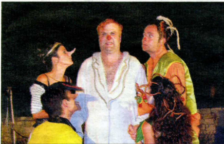
Une nouvelle pièce de Molière à l'Aven d'Orgnac : « Le malade imaginaire ».

Depuis le 15 juillet et jusqu'au 14 août, tous les soirs à 21 h 30, le collectif Athome et la Coopérative Théâtre proposent « Un malade imaginaire » à l'Aven d'Orgnac, dans les jardins en terrasse. Après le succès l'année dernière de George Dandin, le collectif Athome et la Coopérative Théâtre remettent le couvert avec cette adaptation de Molière.