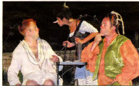
Le malade imaginaire comme on ne l'avait imaginé.

L'Aven d'Orgnac est un Grand Site, on le sait et cela a été confirmé il y a quelques semaines par le renouvellement du Label Grand Site de France. Mais le site de l'Aven est aussi très innovant. Pour la deuxième année consécutive y est présentée une pièce de théâtre à la belle étoile, sur les terrasses du site. Et la pièce, une adaptation de la plus célèbre comédie de Molière, « Le malade imaginaire », rencontre un vif succès : 20 % d'entrées en plus par rapport à 2009. Dans une très belle mise en scène, spécialement adaptée à ce lieu, les comédiens jouent